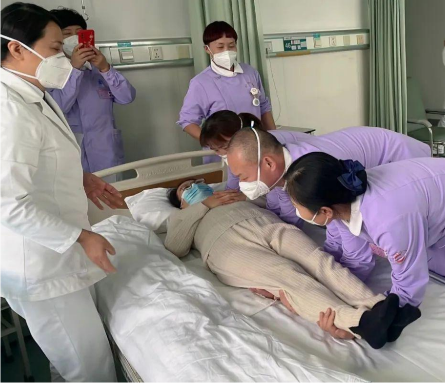
淄博市中心医院东院创伤骨科集中管理病房