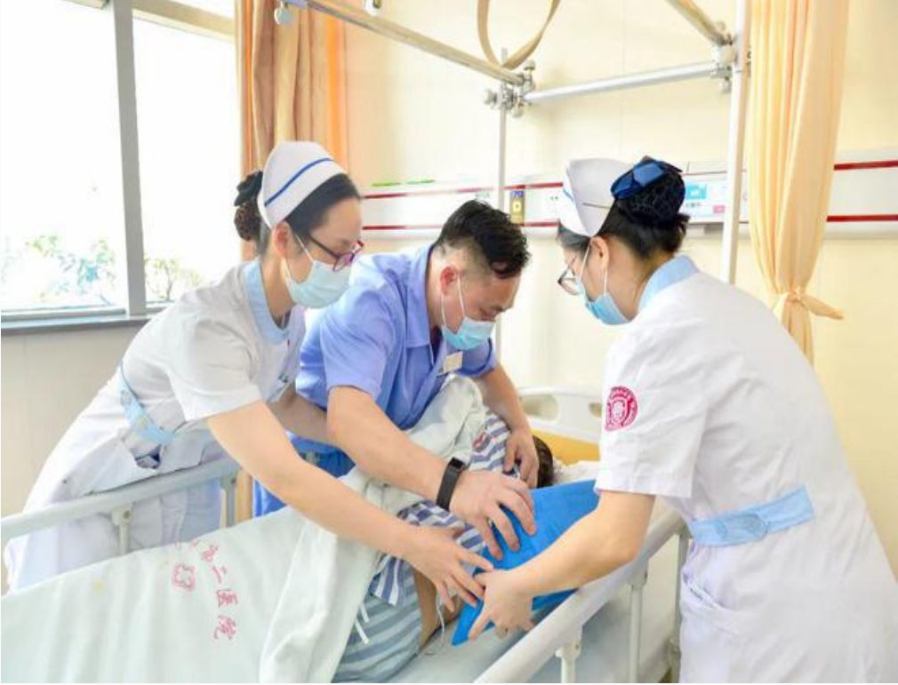
福州市第二总医院脊柱外科无陪护病房