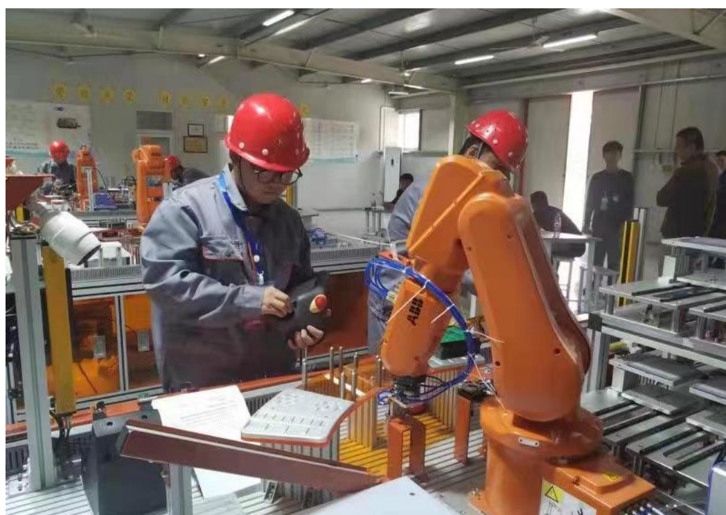
工业机器人技能大赛