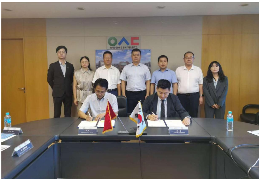
与韩国又松大学签署合作协议