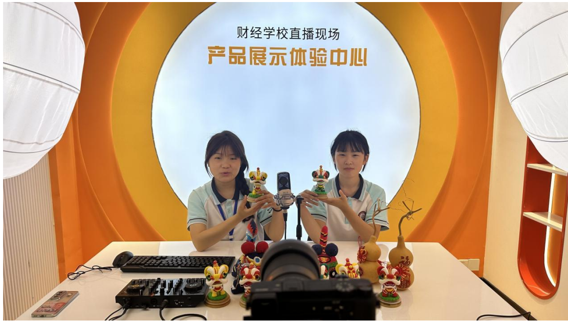
电子商务直播课堂