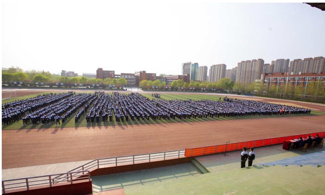
技能大赛总结表彰