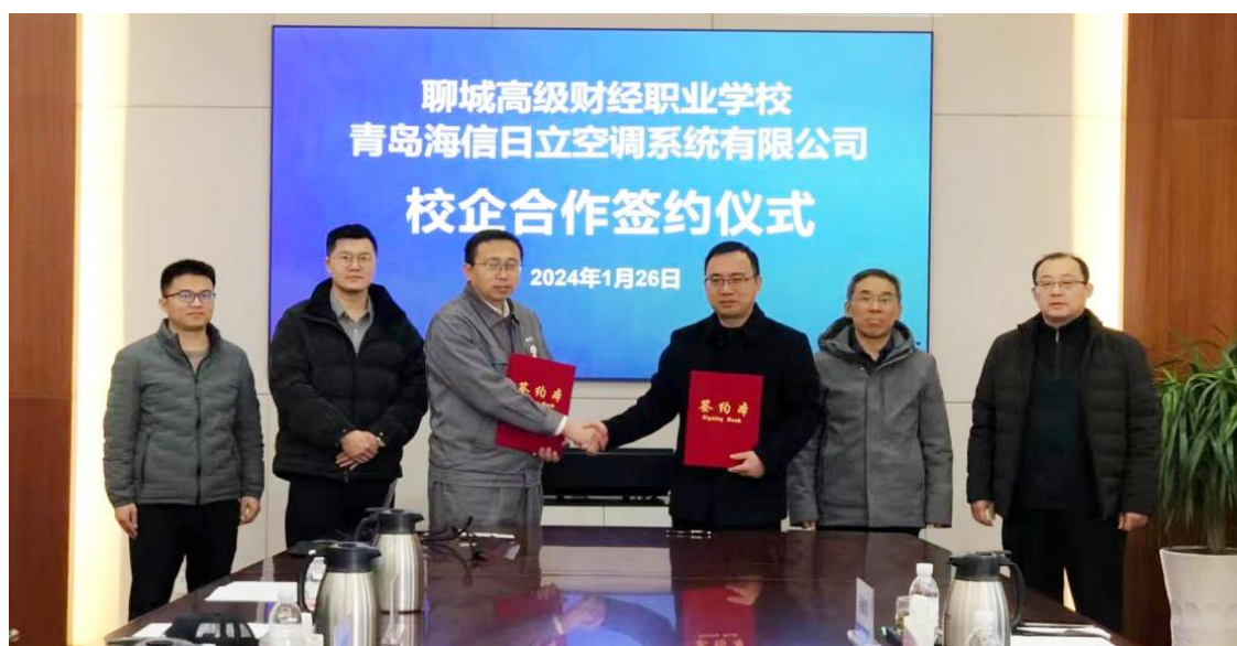
校企合作签约仪式