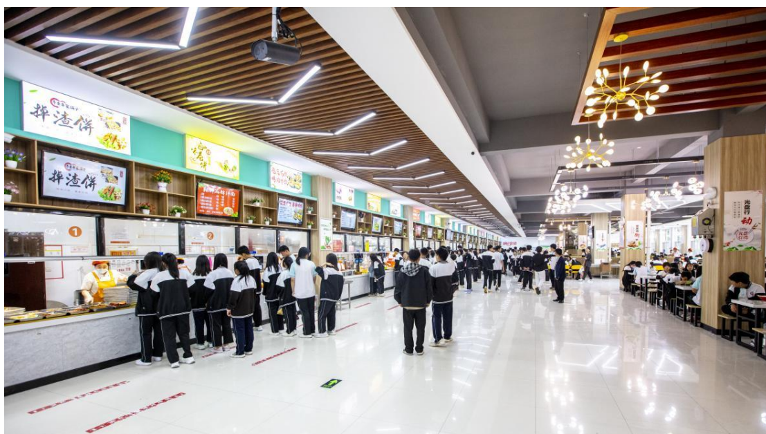
“食安山东”示范餐厅