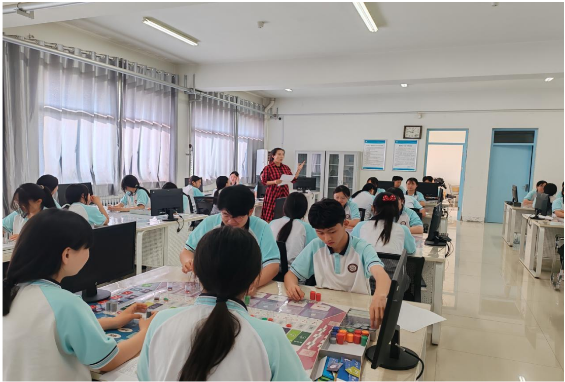
企业经营沙盘模拟训练